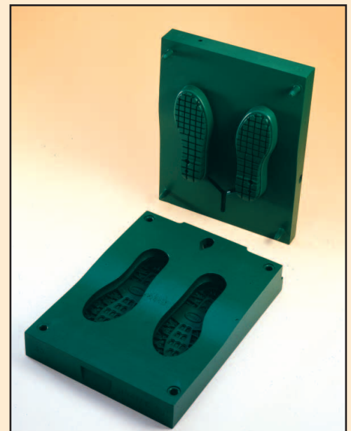
MOLDES para industria del caucho

!!! RESISTENCIA TÉRMICA -190°C a +260°C !!!