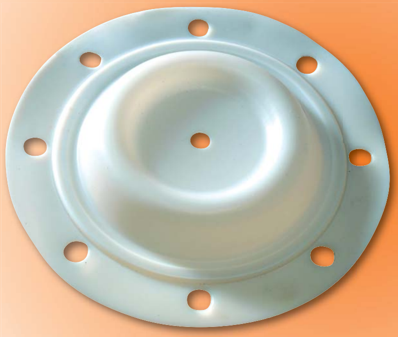
PTFE / TFM