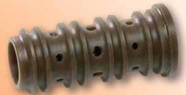
POM + PTFE