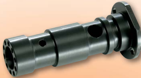
NYLATRON GS ®